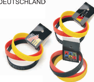
Armbänder 3er-Set DEUTSCHLAND

Material: Plastik / gummierte Griffzone Austauschbare blaue Mine