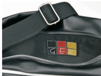
Detail / Innenansicht

Ausstattung: Großes Hauptfach mit RV, Zusatzfach vorne, Innenfach mit RV, Handyfach, verstellbarer Trägerrgurt Metallfüsse