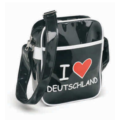
Retrotasche "I love Deutschland" Lack