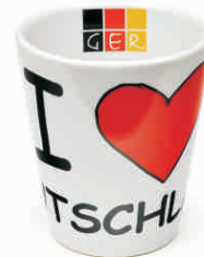
Tasse "I love Deutschland" weiß

Material: Porzellan Höhe: 10 cm / Durchmesser: 9 cm