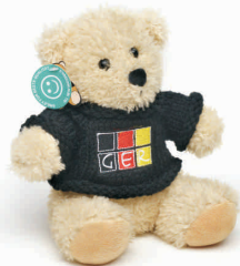
Plüschbär GER mit Strickpulli

Material: Porzellan Höhe: 10 cm / Durchmesser: 9 cm