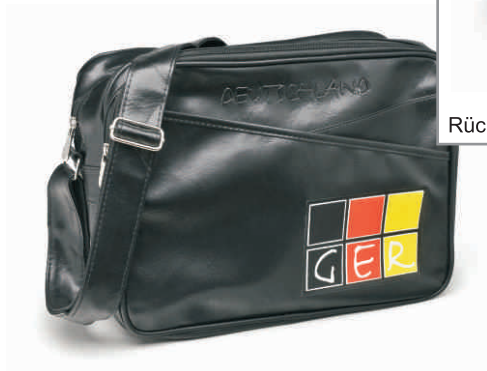
Retrotasche GER 3D schwarz