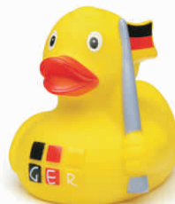
Ente GER gelb mit Fahne