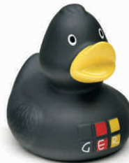
Ente GER schwarz