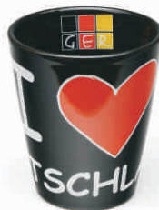
Tasse "I love Deutschland" schwarz

Material: Porzellan Höhe: 9,6 cm / Durchmesser: 8,2 cm