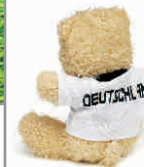
Plüschbär GER / DEUTSCHLAND-Trikot