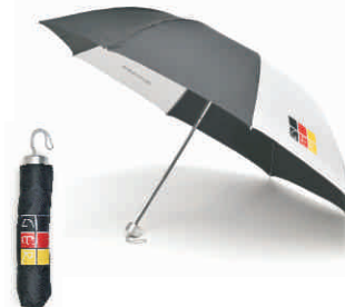
Faltregenschirm GER schwarz-weiß